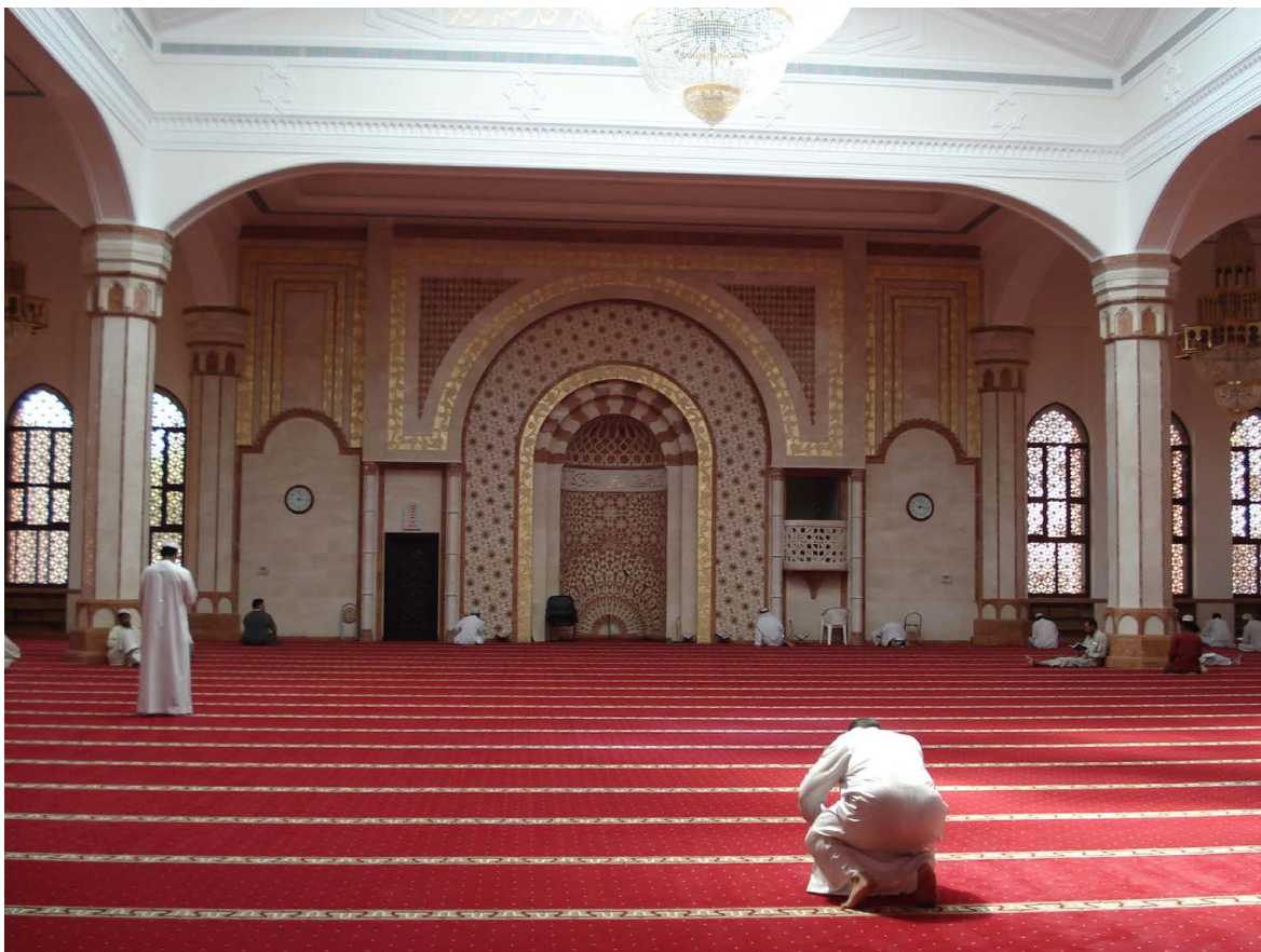
Betende und den Koran studierende Muslime in einer Moschee im arabischen Stil

Zugleich birgt die Islamisierung einen geschickten Ausweg aus der Ölfalle, in die sich das Sultanat manövrierte: Schon lange bedrohen schrumpfende Reserven und sinkende Ölpreise das luxuriöse Leben der Herrscherfamilie und gefährden die sozialpolitisch geförderte, mit Petrodollars finanzierte Loyalität ihrer Untertanen. Mithin steht für den Fall einer wachsenden öffentlichen Unzufriedenheit durch sinkenden Wohlstand ein breites rechtliches Repertoire bereit, um kritische Stimmen und politische Forderungen abzuwehren. Oder mit den Worten des Sultans: Der Islam dient als eine »Firewall gegen die Globalisierung«.