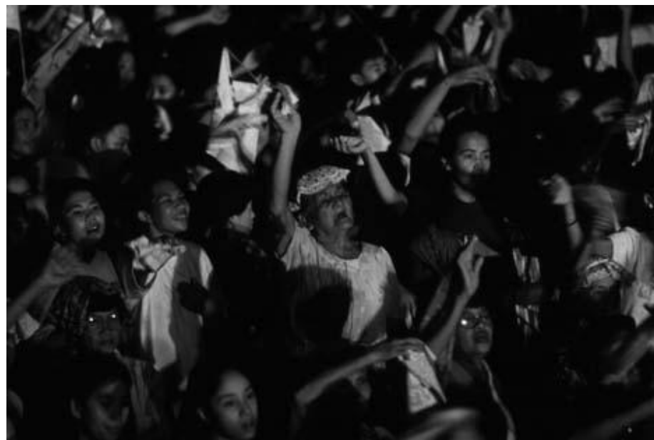
»Doing theology« — Volksreligiösität zu Wort kommen lassen

Die Aufständischen ahnten, dass sich die Soldaten vor Gottes Strafe fürchteten, wenn sie Gläubige oder gar Nonnen erschießen würden; und die Soldaten vermuteten, dass die Aufständischen dies ahnen würden.