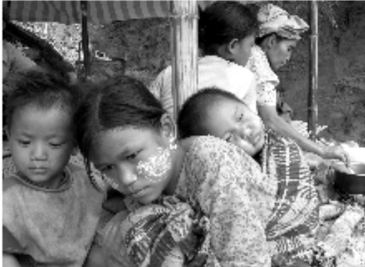
Kinder, die vor der burmesischen Armee geflohen sind

ein hundred Fischarten wandern zwischen dem Nu/Salween und seinen Nebenflüssen und die den Fluss umgebenden Wälder gehören zu denjenigen mit den weltweit höchsten Bestände an Teakbäumen. Dieses einzigartige Gebiet ist gefährdet.