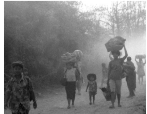
Menschen, die wegen eines Entwicklungsprojektes ihr Dorf verlassen mussten

Der genannte Hauptzweck der Dämme ist es, große Mengen “billiger” Elektrizität für Thailand sowie “viel benötigte Auslandsdevisen“ für Burmas Militärregierung zur Verfügung zu stellen. Thailand hat die Erfahrung mit starkem Widerstand der Bevölkerung gegen den Bau von Dämmen und kohlebetriebenen Kraftwerken im eigenen Land gemacht. Nun werden Verträge geschlossen, um Elektrizität aus Wasserkraft aus den Nachbarländern mit autoritären Regimes zu importieren, wo die Bürgerinnen und Bürger die Regierungsprojekte nicht infrage stellen dürfen ohne die begründete Angst vor Repressalien.