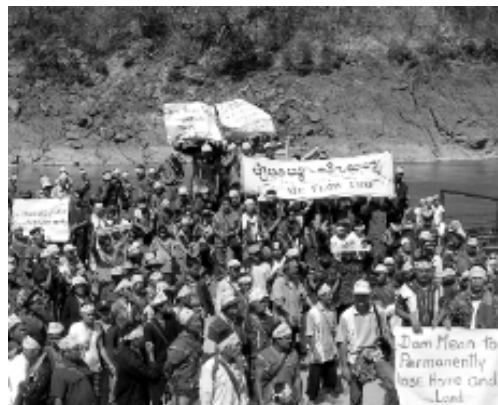
Dorfbewohner protestieren gegen Salween-Dämme in Burma

Trotz des großen Risikos, in einem Kriegsgebiet eines Landes zu operieren, das von Transparency International als eines der fünftkorruptesten Länder eingestuft wird, wären die Salween-Dämme mit zehn Milliarden US-Dollar die größte Investition bisher in Burma. Unerwartete Kosten und Verzögerungen könnten leicht zur Verdopplung der Kosten führen. Allein der Bau des Tasang-Damms würde ein Minimum von sieben Milliarden US-Dollar ins Land und die Vertragsunternehmen schütten, ein Erlös, der es dem Regime erlauben würde, die Macht zu erhalten. Und obwohl Burma große und anhaltende Energiekrisen hat, erhalten das Land und seine Menschen wenig von der Elektrizität aus diesen Dämmen.