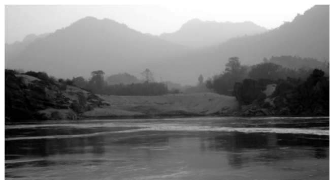
Der Salween in Burma

Die Auswirkungen des geplanten Staudammprojektes auf die Umwelt werden grundlegend und unwiderruflich sein. Der Salween, der in China Nu und in Burma Thanlwin genannt wird, ist nach wie vor der längste frei fließende, nicht von Barrieren unterbrochene Fluss des südostasiatischen Festlandes. Das Stromgebiet des Flusses wurde wegen seiner großen Artenvielfalt, seltener Wildtiere und international bedeutsamer Feuchtgebiete von der UNESCO zum Weltnaturerbe bestimmt. Annähernd