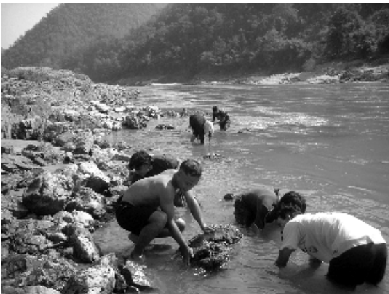
Dorfbewohner sammeln Nahrung vom Fluss

Dort, wo der Salween entlang der der thailändisch-burmesischen Grenze fließt, leben mindestens dreizehn ethnische Gruppen, darunter die Shan, Karen, Karenni, Mon, Wa, Pa-O, Lahu, Padaung, Akha, Lisu und Palaung in traditionellen Gemeinschaften an den Ufern des Flusses. Unter dem gegenwärtigen Militärregime wird es hinsichtlich der Staudämme keine öffentliche Beteiligung in irgendeiner Form geben und die Gemeinschaften, die gezwungen sein werden alle negativen Auswirkungen des Staudammbaus zu tragen, werden keinerlei Vorteile daraus ziehen. Es ist gut dokumentiert, dass Staudämme in Burma mit Hilfe von Zwangsarbeit gebaut werden. Darüber hinaus werden die Dorfbewohner vom Militär zur Umsiedlung gezwungen, ohne dafür entschädigt zu werden.