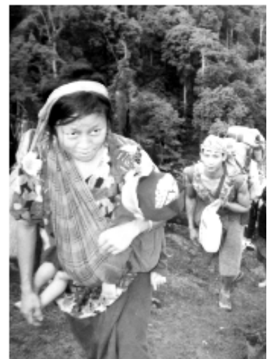
Interne Vertriebene auf der Flucht

Der erste Damm, der in der 600-1200 Megawatt-Serie gebaut werden wird, ist der Hutgyi Damm im Karen Staat, wo die seit vielen Jahren größte und am längsten andauernde Militäroffensive der burmesischen Armee stattfindet. Eine neue Offensive, die angeordnet wurde, als die wichtigsten Vereinbarungen zwischen den Ländern und den jeweiligen Firmen abgeschlossen und unterschrieben waren, hat zu einer geschätzten Zahl von 15.000 neuerlich Vertriebenen in den letzten acht Monaten geführt. Durch eine der in der ganzen Region verstreut liegenden Landminen wurde ein Arbeiter von EGAT, der bei der Machbarkeitsstudie beteiligt war, getötet. Nach dessen Tod haben sich die Arbeitsgruppen von EGAT und der Machbarkeitsstudie aus der Gegend zurückgezogen. Obwohl EGAT nur unvollständige Daten hat, um die Studie ordnungsgemäß zu beenden, hat sie den Plan gefasst, zur nächsten Stufe des Staudammbaus voranzuschreiten.