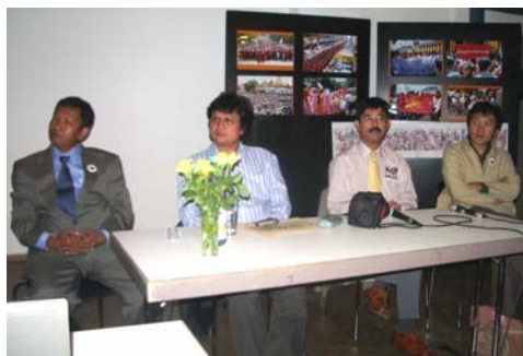
Veranstaltung, 14.6.08, Berlin

Unsere Aktivitäten im Jahr 2008 standen im Zeichen des 20. Jahrestages der blutigen Niederschlagung der Proteste von 1988. Damals protestierten in Burma Zehntausende Menschen angeführt von Studenten gegen die Militärregierung. Die Proteste wurden gewaltsam unterdrückt. Mehrere Tausend Menschen verloren am 8.8.1988 ihr Leben.