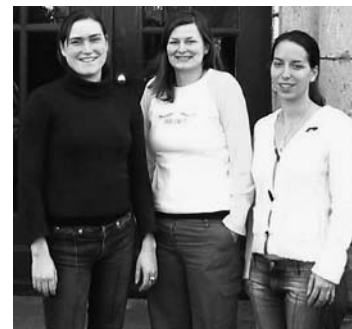
Praktikantinnen im Asienhaus, März 2004

Dabei sind die ehrenamtlichen MitarbeiterInnen für uns nicht eine Quelle billiger Arbeitskraft. Wir lernen auch von ihren Ideen und Initiativen. Viele von ihnen werden im Asienhaus mit der Arbeitsweise einer NRO vertraut und bleiben auch nach dieser Zeit dem