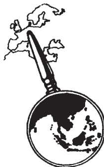
Das Logo der Südostasien-Infostelle

Mit Ihrem Informationsangebot hat die Südostasien Informationsstelle eine ganze Region im Blick. Hintergründe über Entwicklungen werden fachkundig über verschiedene Angebote vermittelt.