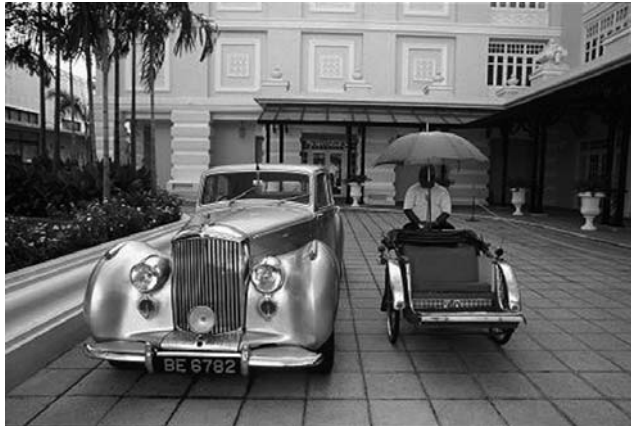
Kontraste in Penang, Malaysia

Die Ausstellung traf auf großes Interesse des Publikums. Da sie von leicht zugänglichen Orten gezeigt wurde, kamen viele Menschen mit diesem Thema in Kontakt, die wir sonst mit unseren Angeboten nicht erreichen.