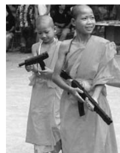
Kindersoldaten in Burma

Auswirkungen auf die Entwicklungen in dieser Region hatte auch der Irak-Krieg. Durch eine Serie von Artikeln haben wir über Reaktionen in asiatischen Ländern informiert.