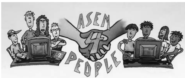
Das Logo des ASEM Peoples' Forum Kopenhagen 2002

komitees. Unsere Mitarbeit konzentriert sich dabei auf die Stärkung der sozialen Dimension des ASEM-Prozesses.