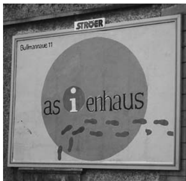
Philippinische Künstler zur Eröffnung des Asienhauses

Wir haben Sie neugierig gemacht und möchten gerne mehr zu den Zustiftungsmöglichkeiten wissen? Wir stehen gerne zu einem persönlichen Gespräch bereit.