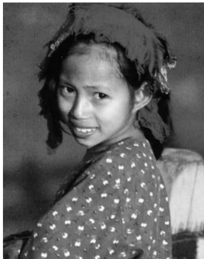
Eine junge Frau im Kachin-Staat

gung bei der Bundesregierung und der Europäischen Union Gehör finden und sich die europäischen Staaten noch stärker für eine politische Lösung für Burma einsetzen.