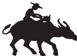
Das Logo des philippinenbüros

serkraftwerke im Süden von Manila durchgeführt, Materialien für verschiedene Organisationen und Veranstaltungen zusammengestellt, aber auch ein Redakteur der Zeitschrift GEO bei der Planung einer Recherche in die Philippinen unterstützt.