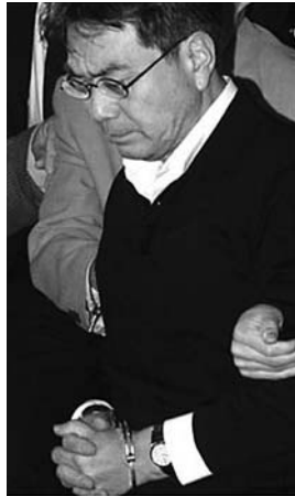
Prof. Song Du-Yul in Seoul verhaftet und vor Gericht gestellt

Unter den zahlreichen Ereignissen auf der koreanischen Halbinsel im Jahre 2003 richtete der Korea-Verband seine Aufmerksamkeit u.a. auf das Folgende: