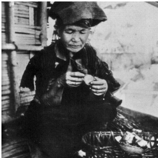
Alte Menschen kennen Opium schon ihr Leben lang.

vorhandenen) Ärzte verschreiben sie? Wer soll sie bezahlen? Und nicht zuletzt bleibt offen, welche Pflanze ein äquivalenter Ersatz für die Mohnpflanze sein könnte, die nicht nur Opium liefert, sondern Nahrungsmittel, Öl- und Brennstofflieferant und somit eine perfekte Pflanze für die Höhenlage und den dortigen Kreislauf der Felderbewirtschaftung ist. Rohopium lässt sich über Jahre lagern und kann zudem den vornehmlich subsistent lebenden Bergbauern und -Bäuerinnen als finanzielle Rücklage dienen.