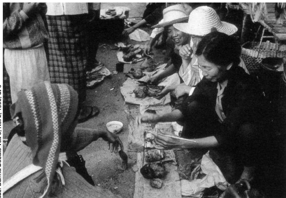
aus: Burma Debate Vol. 5, No. 2, 1996, S. 6

Sollte es tatsächlich gelingen, den Opiumanbau in Laos zu unterbinden, stellen sich bislang unbeantwortbare Fragen: Wie sollen die legalisierten Medikamente in die Berge von Laos gelangen? Welche (nicht