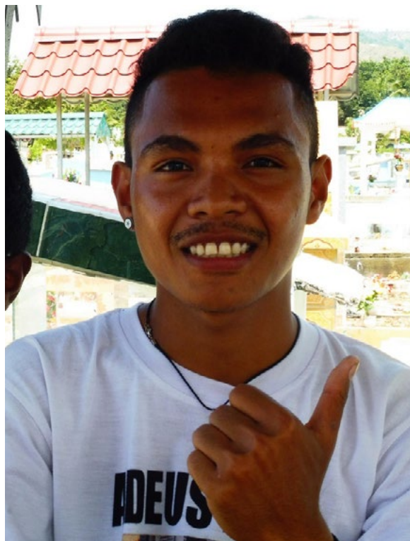
Esteban P. © Monika Schlicher

ben, müssen wir lernen in Frieden, in einer friedlichen Gesellschaft zu leben.