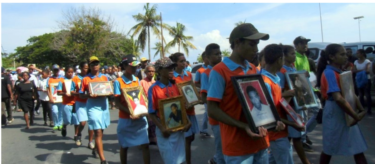
Die Jugend gedenkt der Opfer.

den. Heute muss der Beitrag der Jugend Lernen und Wissen sein. Nur so können sie zur Weiterentwicklung dieses Landes beitragen. Die Jugend hat offensichtlich viele Werte verloren, muss sich neu entscheiden, was und wem sie ihr Leben, ihre Zeit widmen will um wieder Orientierung zu finden. Deshalb ist es wichtig, zu beobachten, welche Erziehung und Angebote es momentan für die Jugend gibt, d. h. was und wie sie unterstützt werden, auch von uns »Alten« lernen können. Diejenigen, die sich der Geschichte verweigern, sich von der Vergangenheit abwenden, laufen davon, treiben sich herum, haben keine Perspektive, was auch ein Grund für Gewalt ist. Sich mit der Geschichte unseres Landes zu beschäftigen, ist etwas, das in der Familie beginnen muss. Zum Beispiel in meiner Familie: ich erziehe meine Kinder, aufgrund der Haltung und der Erfahrungen, die ich in meinem Leben gemacht habe, als Kind, vor allem als Jugendliche. Ich erzähle ihnen von meinen Erfahrungen und sie können das aufnehmen und in ihrem eigenen Leben umsetzen, Fähigkeiten üben, die ihr Leben reicher macht.