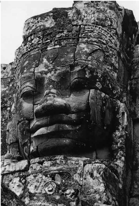
Eines von 216 Gesichtern des Bayon-Tempels.

Diese symbiotische Koexistenz von geistlicher und weltlicher Macht hielt bis in die 1970er Jahre. Das Ende der Monarchie nach über 1.000 Jahren hatte der Sangha , der sich politisch flexibel zeigte und sein Schicksal nicht mit dem des abgesetzten Prinz Sihanouk verbinden wollte, noch schadlos überstanden. Aber mit dem Terrorregime der Roten Khmer, die Kambodscha ab April 1975 in ein Schlachthaus verwandelten, wurden die klerikalen Würdenträger plötzlich zu Staatsfeinden erklärt. Bis zum Ende der