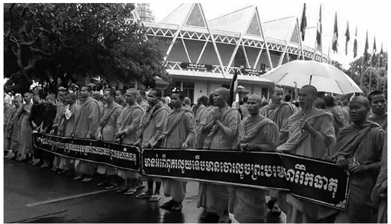
Mönche demonstrieren gegen Korruption.

Mit Wiedereinrichtung der Monarchie (Staatsmotto: ›Nation – Religion – König‹) und der Reintegration der königlichen Familie und ihrer Anhänger kam Anfang der 1990er Jahre der traditionelle Partner des klerikalen Buddhismus zurück nach Kambodscha. In dem erbitterten Kampf um die politische Macht zwischen Royalisten und Postkommunisten, der im Juli 1997 in einem gewaltsamen Putsch Hun