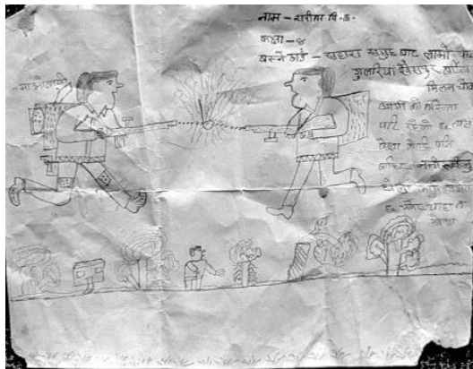
Abbildung 1: Kinderzeichnung von Kämpfen zwischen der CPN (Maoisten) und der Königlichen Nepalesischen Armee.